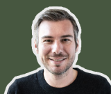
Matthias Reiser Architektur und Design