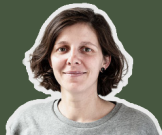
Ana Remis Erstberatung und Technologieplanung